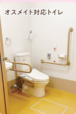
オスメイト対応トイレ